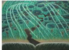
夜、仙果なるワクワクの木(2022年)

※期間中にギャラリートークやワークショップを開催します。また、英さんと直接交流する機会もあります。詳細は、ホームページにてご確認ください。