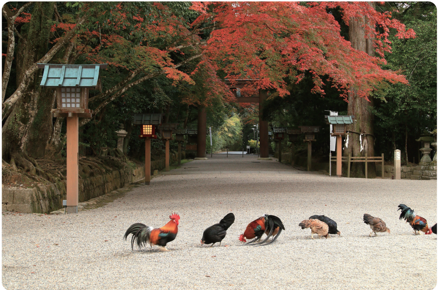
天理市観光協会フォトコンテスト入賞作品「前にならえ」(石上神宮にて)