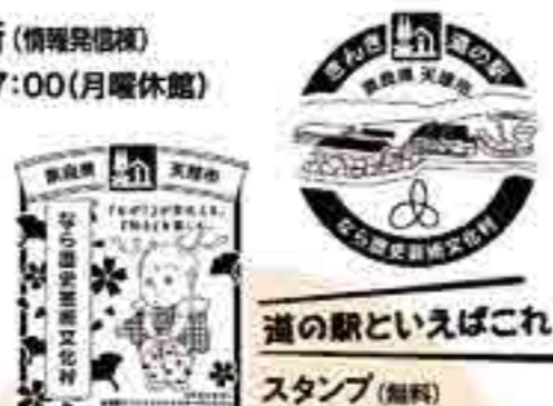
道の駅といえばこれ! スタンプ(無料)

奈良県内の道の駅で販売されているカードに、文化村が加わりました。購入時に押印するスタンプを全駅制覇するとコンプリートカードがもらえます。