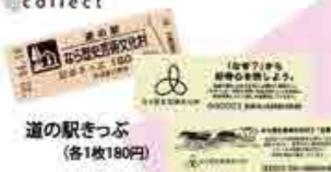
道の駅きっぷ (各1枚180円)

発売以来コレクターに大人気の道の駅きっぷ。文化村でもご用意しています。現在は第2弾のデザインを販売中。(第1弾は発売)次弾のデザインもお楽しみに!!