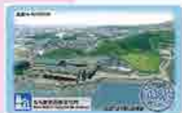
道の駅カード (1枚200円)

発売以来コレクターに大人気の道の駅きっぷ。文化村でもご用意しています。現在は第2弾のデザインを販売中。(第1弾は発売)次弾のデザインもお楽しみに!!