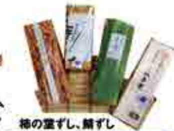
文化村にぎわい市場