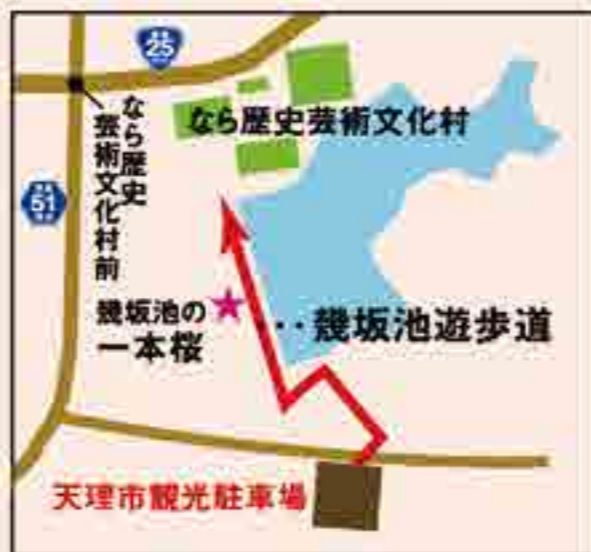
天理市観光駐車場