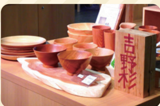
木目が美しい 吉野杉の茶碗、皿、コップなど

吉野杉・檜などの天然木を素材とした木工品をはじめ、奈良墨、筆、茶筌、赤膚焼、一刀彫、蚊帳製品などの伝統工芸品を展示・販売しています。また、季節に合わせた期間限定商品も取り扱っており、ディスプレイが美しく楽しい売場です。