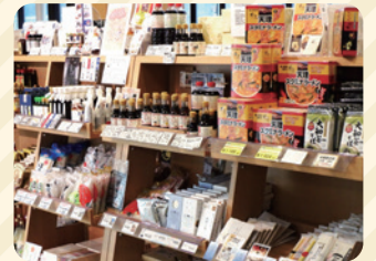
麺類・めんつゆ・調味料など