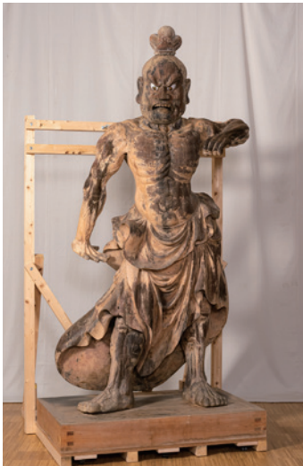
葛城市指定文化財 當麻寺仁王像(阿形像)

令和4年5月より、文化村修復工房にて修理を行ってきた葛城市・當麻寺の仁王像(阿形像)の修理完成を記念して、お披露目展示を開催します。修理中に得られた知見や仁王像に関する資料もあわせてご紹介します。