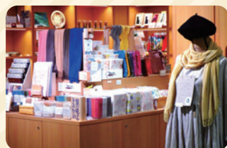
伝統工芸品の蚊帳製品