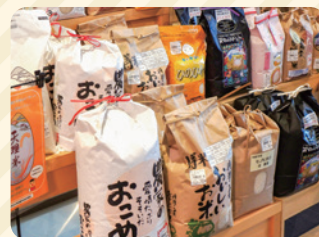
米・食味分析鑑定コンクール 金賞などの希少米