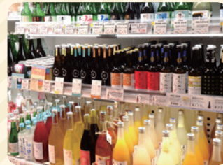
種類が豊富な地酒や果実酒

地酒・果実酒、麺類・調味料、奈良漬け、柿の葉寿司、希少米、洋菓子・和菓子・おかきなどの菓子類、季節のお土産、ご当地サイダー、ジビエ、お弁当など、バラエティに富んだ商品が並んでいます。