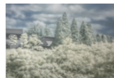
過去作品 伊庭靖子(Untitled 2023-05)

対象物そのものよりも、質感を前景化して油彩画を描く伊庭靖子氏。20年ぶりとなる滞在制作を機に奈良でモチーフを探し、12月から文化村スタジオにて制作した新作と旧作を交えて展示します。